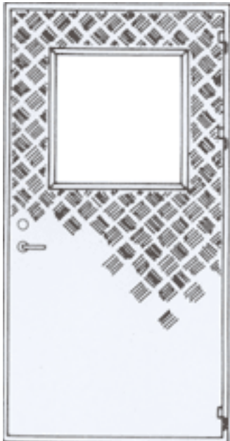
Enkeldörr med isolerruta